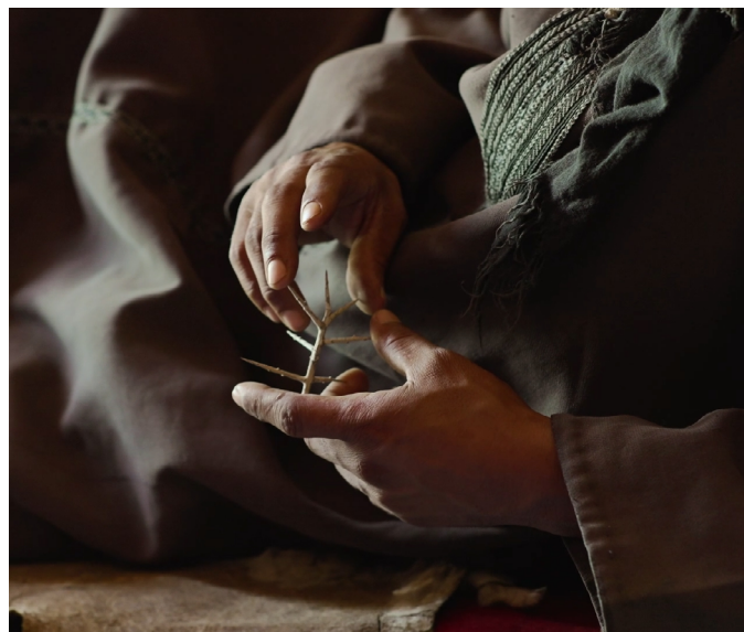
Abdessamad El Montassir, Trab'ssahl , 2023

Événement organisé dans le cadre de la Saison Méditerranée 2026